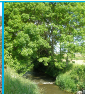
Capacité de récupération du milieu forte Cours d'eau Le Rival, mai 2008.