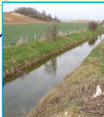
Capacité de récupération du milieu faible Cours d'eau Le Poignon, mars 2007.

« Cette étude a permis de pointer les principaux problèmes sur lesquels la CLE devra faire ses préconisations. Trop de pollutions des cours d'eau sont encore causées par de mauvais assainissements ; les efforts devront porter sur l'assainissement collectif et non collectif et le contrôle des effluents des industriels. Il faudra également mettre l'accent sur les pratiques agricoles. Même si on constate une légère amélioration sur les teneurs en nitrates, cela reste insuffisant pour retrouver une bonne qualité des eaux. En parallèle, il faudra travailler sur les pesticides employés par l'agriculture mais aussi par les collectivités et les particuliers et sur le manque de végétation des berges qui entraîne des phénomènes d'eutrophisation. »